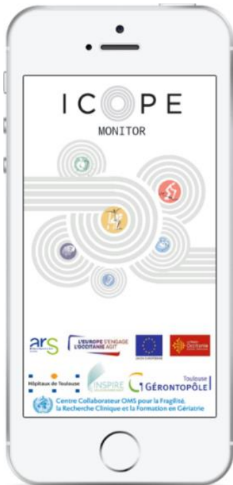
Sur application mobile