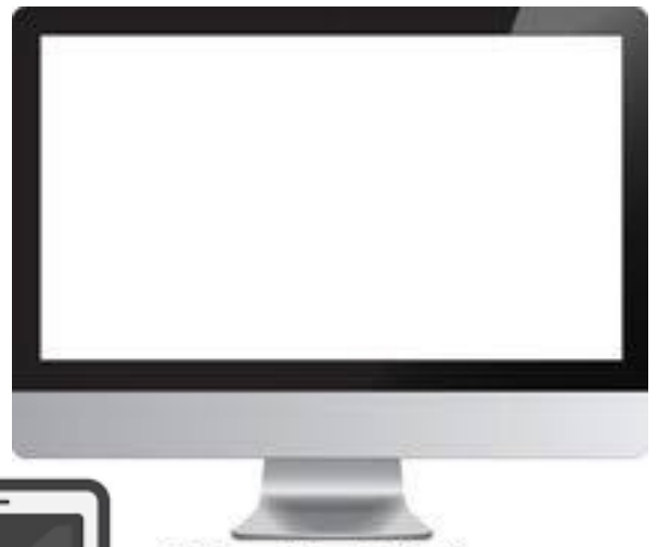
Sur internet (tablette, ordinateur)